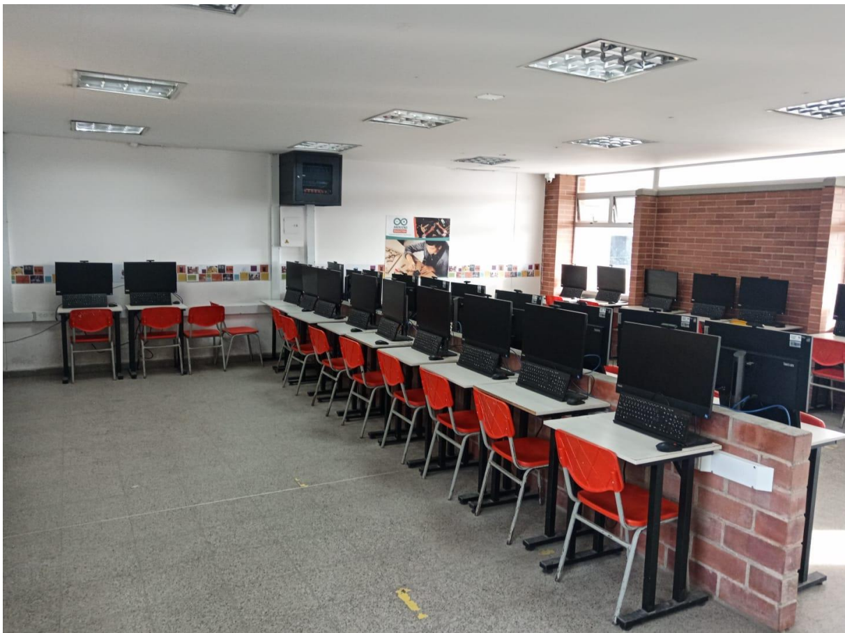
Fotografía No. 1 – Salón de clase (Dotado de escritorios, computadores, televisor y tablero).