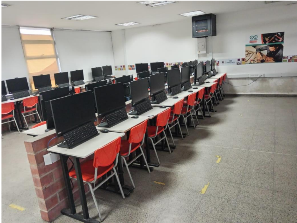
Fotografía No. 2 – Salón de clase (Dotado de escritorios, computadores, televisor y tablero).