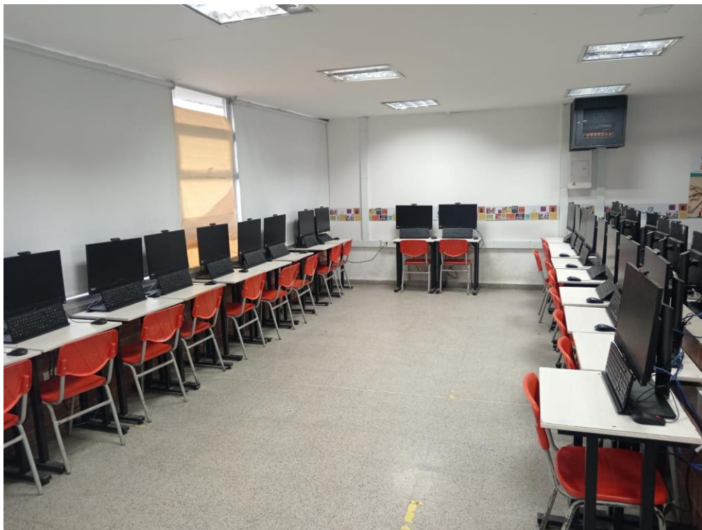
Fotografía No. 3 – Salón de clase (Dotado de escritorios, computadores, televisor y tablero).